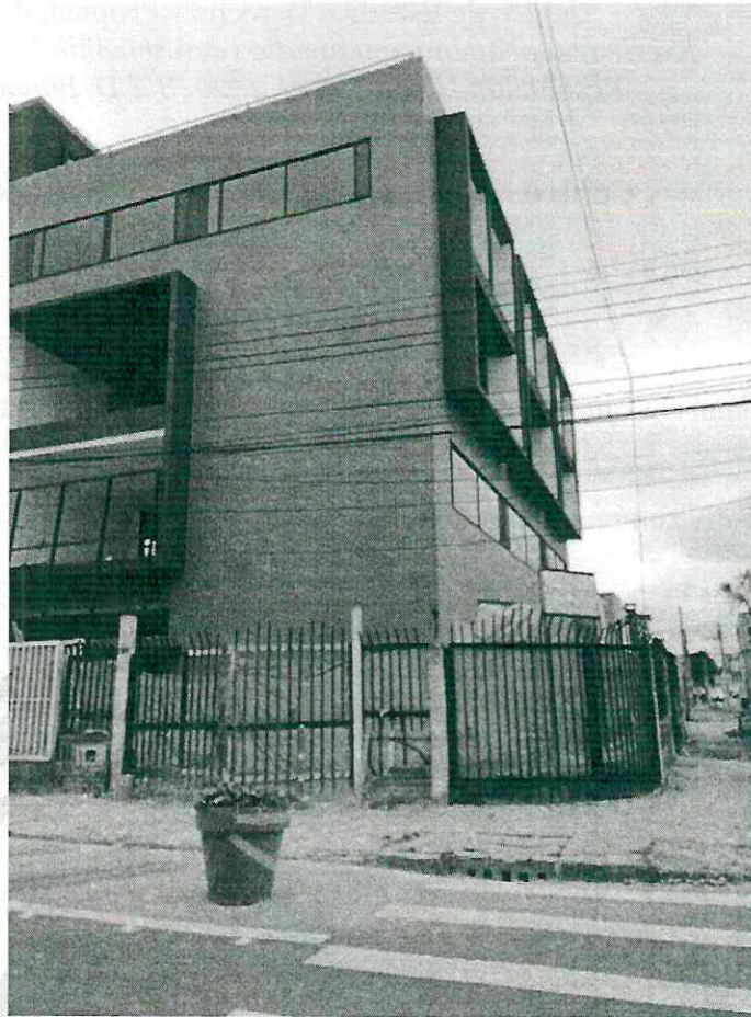
Figura 2. Centro de estudios (etapa de construcción)

Actualmente este consejo directivo procederá a: